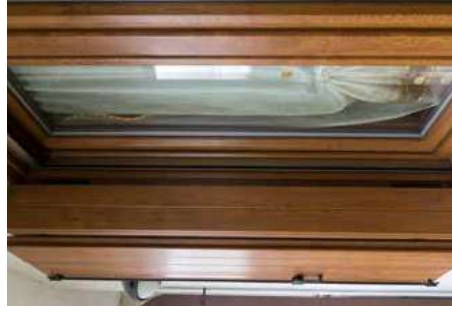
Antone Padovana Vista Laterale