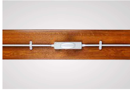
A richiesta ferramenta Colore grigio