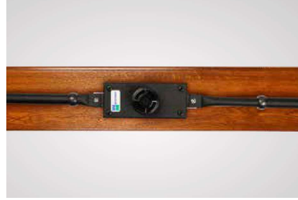
A richiesta serratura Modello Mottura