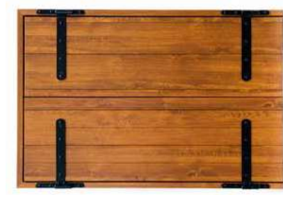
Antone Veneto Vista Esterna