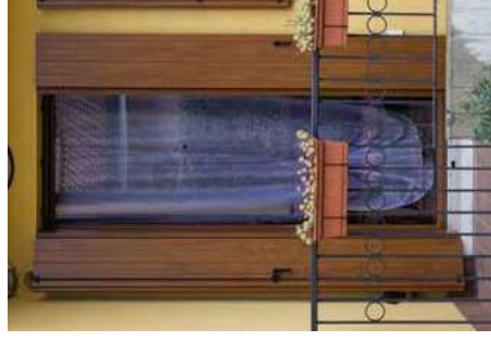
Antone Padovana Vista Esterna