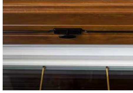
Antone Vicentina Vista Laterale