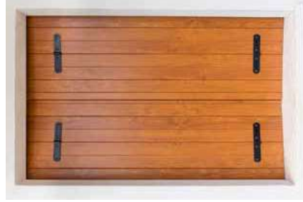
Antone Vicentina Vista Esterna