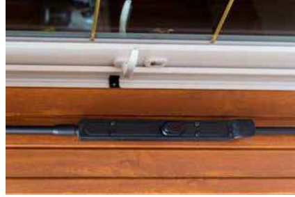
A richiesta serratura Modello Ariete