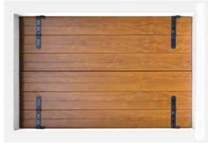
Antone Padovana Vista Esterna