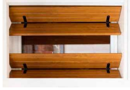
Antone Vicentina Vista Esterna